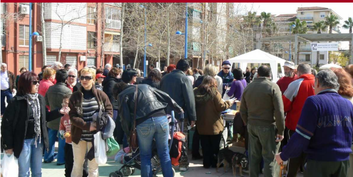
Rastrillo Solidario 2010, organizado por la AA.VV.